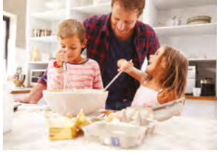
KUCHNIA I STÓŁ STR. 7