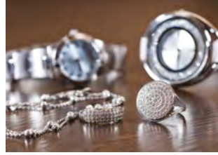
BIŻUTERIA STR. 30