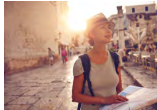
TURYSTYKA STR. 38