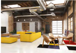
DOM STR. 21