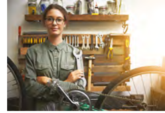
WARSZTAT STR. 42